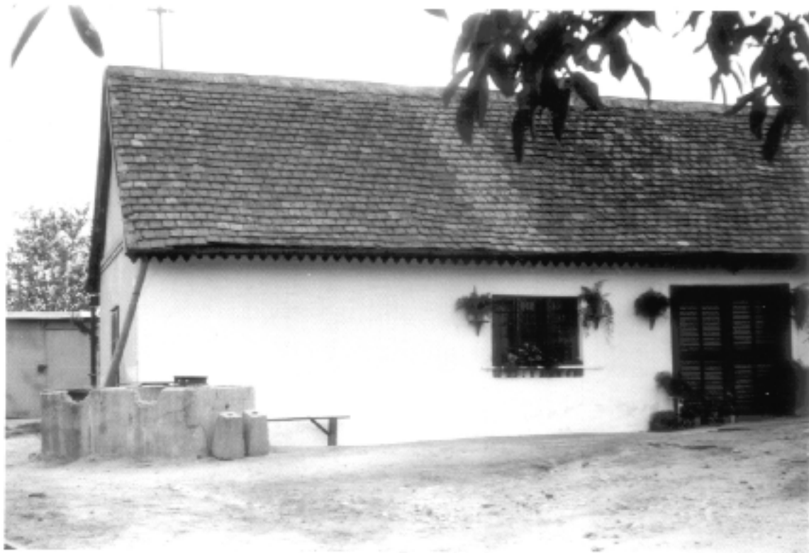
2. sz. fénykép