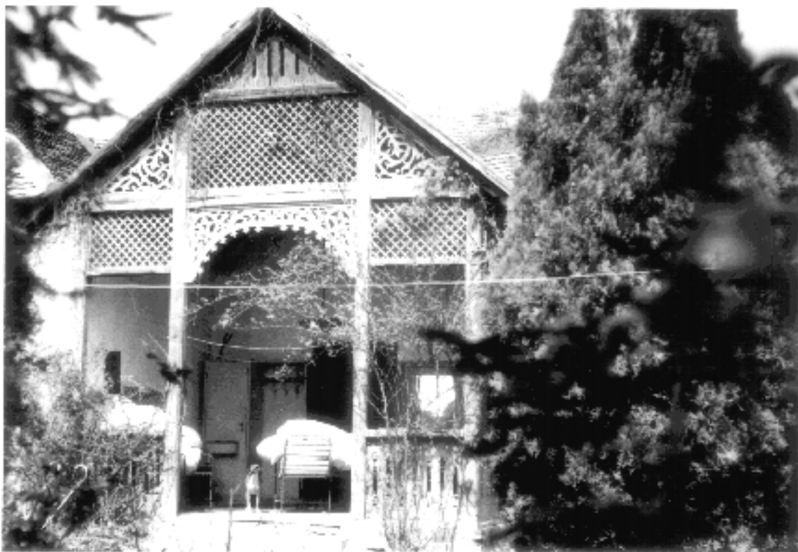
3. sz. fénykép