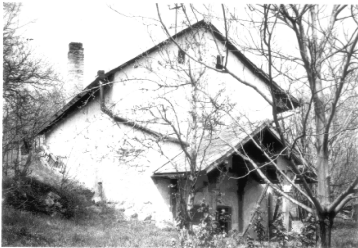
1. sz. fénykép