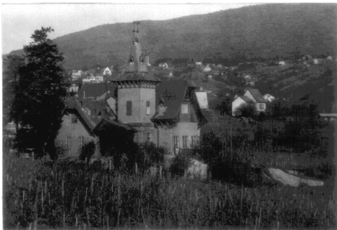
8. sz. fénykép