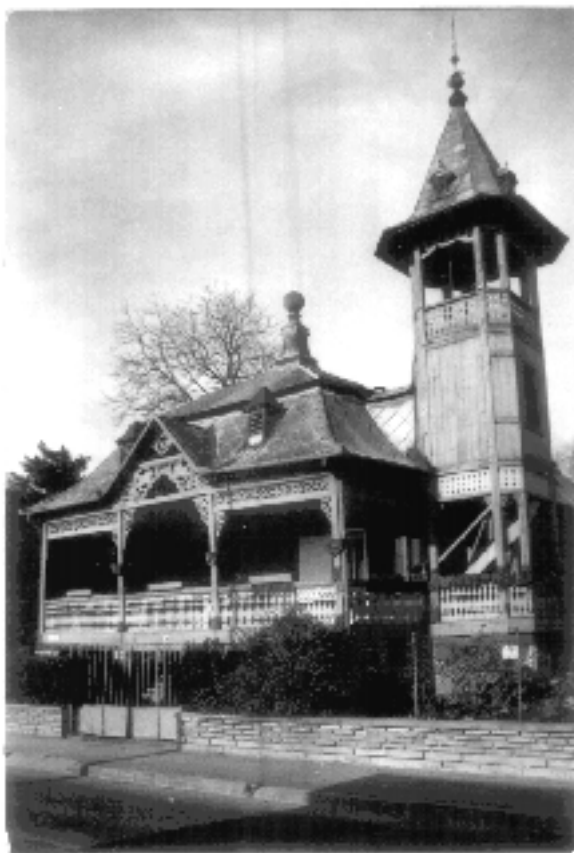
7. sz. fénykép

A táji jellegű épületek eredeti szépségét, formáját, a fa mives építészetének gazdagságát feladatunk megóvni, megtartani.