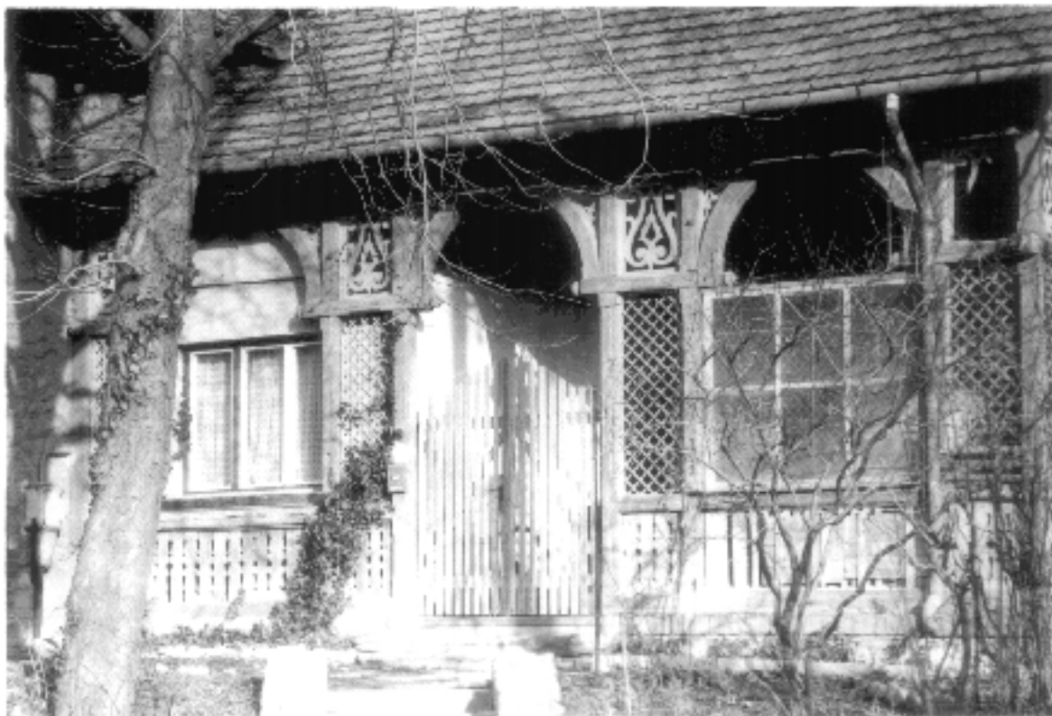
4. sz. fénykép